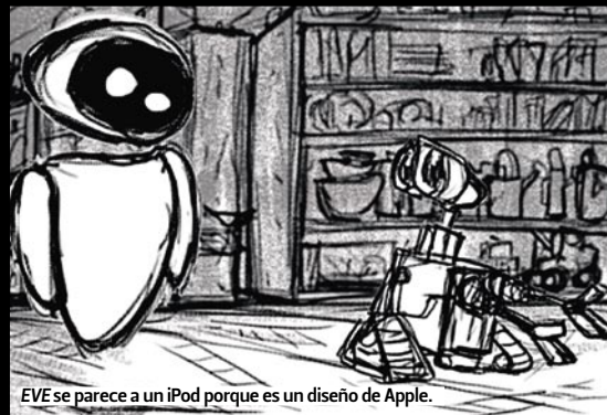
EVE se parece a un iPod porque es un diseño de Apple.

El equipo de animación visitó a científicos de la NASA y enormes plantas de reciclado para observar las trituradoras de basura e incluso se llevaron al estudio robots para estudiar su funcionamiento (entre ellos, un detector de bombas de la policía).